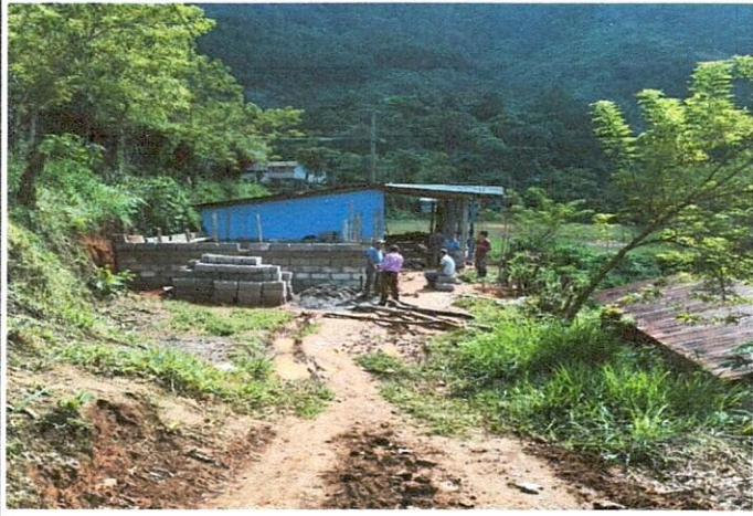
Foto1: Remodelación de aula tipo portico