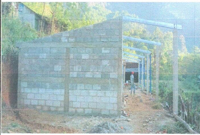
Foto 1: Mejoramiento al módulo de aula (estructura de techo con lámina troquelada calibre 26, piso cerámico, balcones, repación de repello y cernido de paredes)