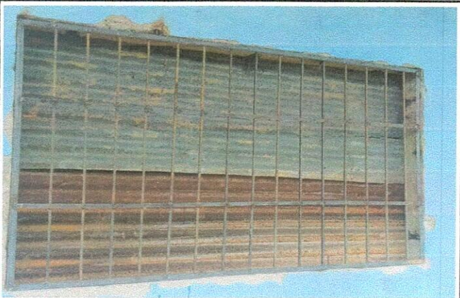
Foto 3: Mejoramiento al módulo de aula (estructura de techo con lámina troquelada calibre 26, piso cerámico, balcones, repación de repello y cernido de paredes)